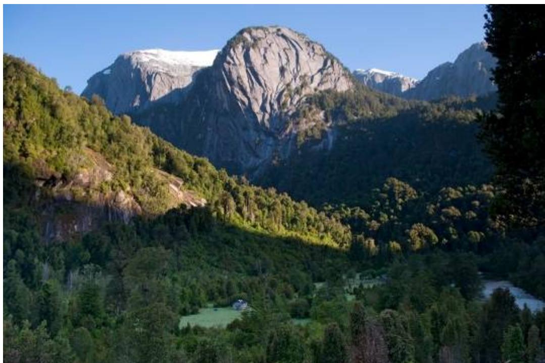
Valle Cochamó, Refugio Las Juntas, 4hrs de caminata día 1.

Fono: (56-65) 234892 Móvil: (56-09) 9121 6948 Web: www.miralejos.travel Mail: info@miralejos.cl