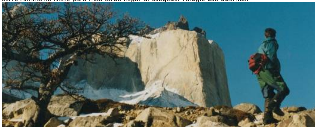
Los Cuernos en día 12

Día 11 Refugio Las Torres / refugio Los Cuernos 16km/ 5hrs trekking Hoy caminaremos a orillas del lago Nordenskjöld y por debajo de los glaciares colgantes del cerro Almirante Nieto para más tarde llegar al acogedor refugio Los Cuernos.