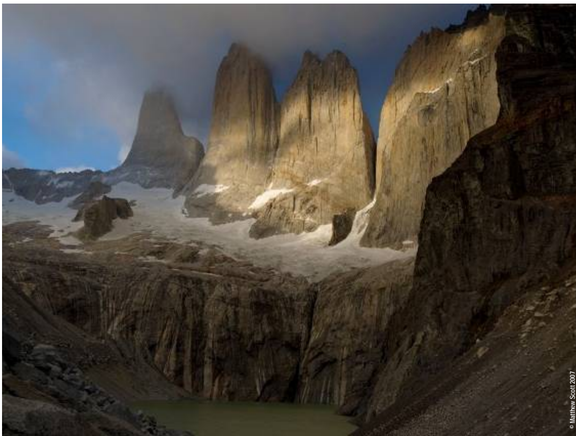
Mirador Las Torres día 10